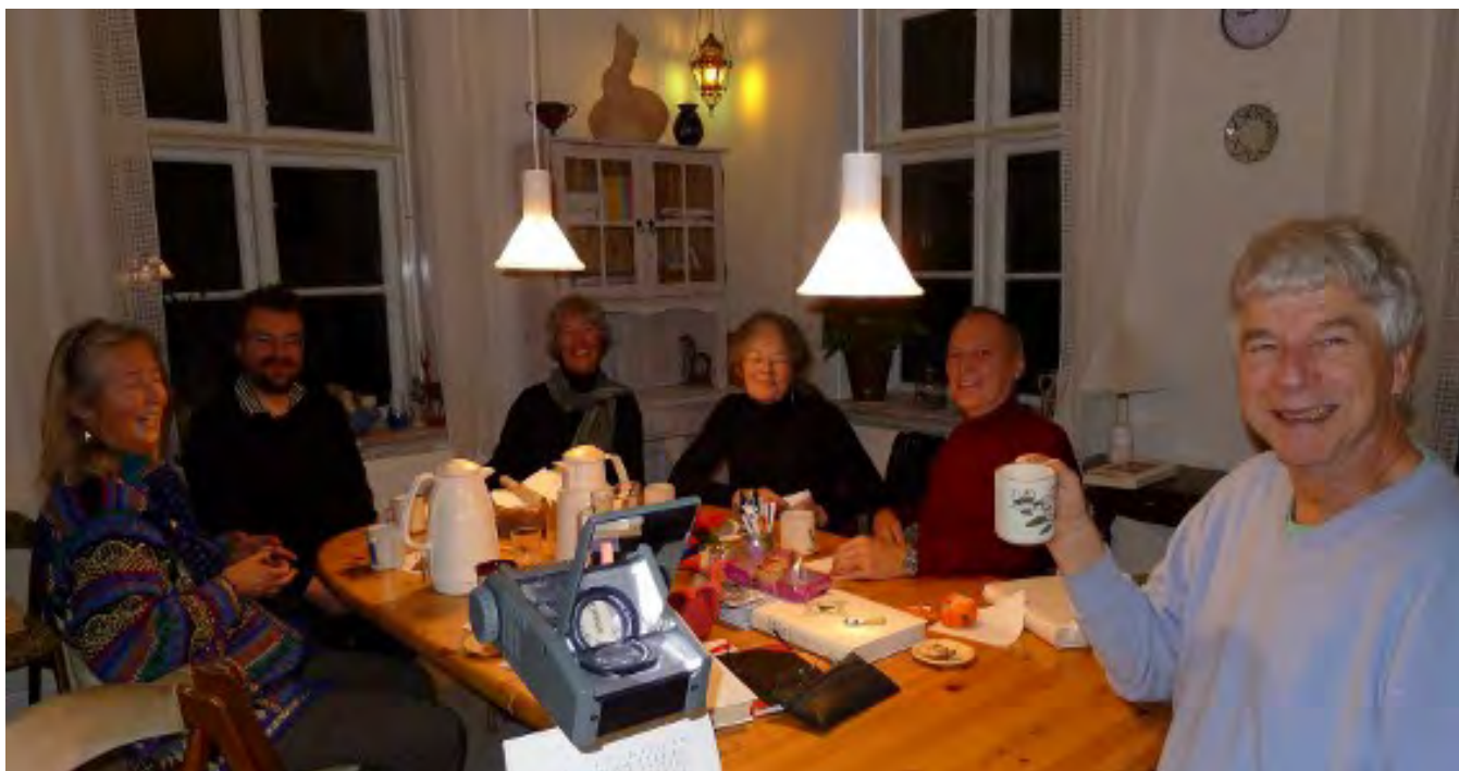
Illustration: Kosmologien giver gode stunder og dejlige venner.