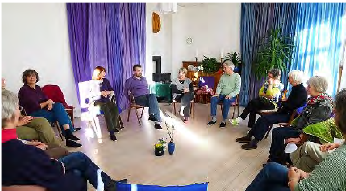
Familieopstillingsgruppen efter en opstilling.